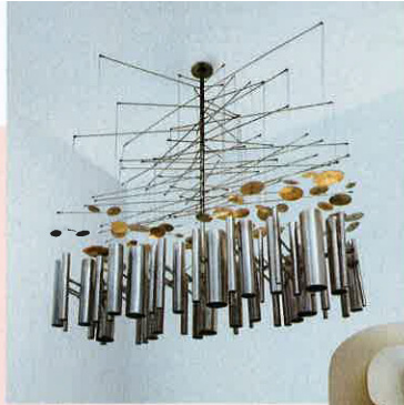
Orgue lumineux Suspension de l'artiste Philolaos Tloupas, une œuvre de 1962 exposée par la galerie Chastel-Maréchal.