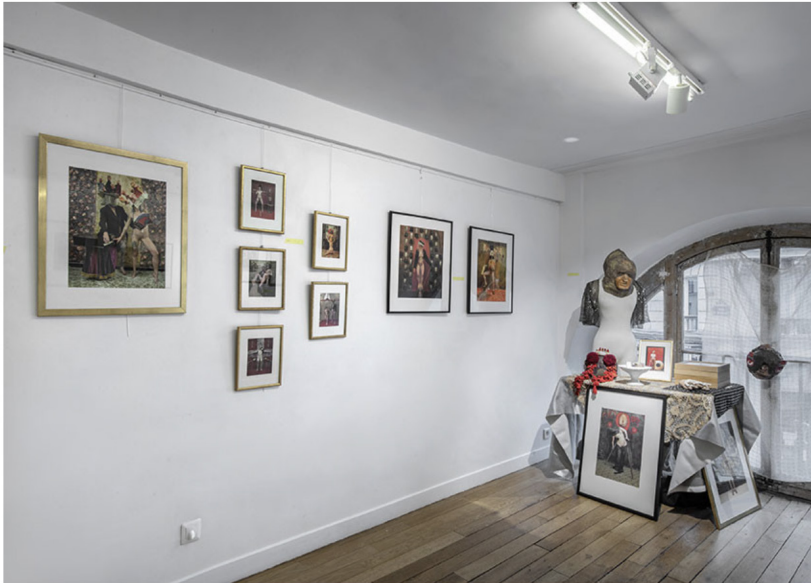
Les œuvres d'Alan Tex sur le stand de Mathilde Hatzenberger à Outsider', 2024