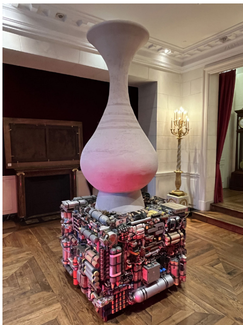
Vue de l'exposition « Bas-relief » d'Adel Abdessemed à la galerie Aveline.

Pari réussi pour l'association de galeries Matignon Saint-Honoré, qui s'était concertée avec les maisons de ventes voisines pour organiser une soirée festive lançant la Semaine de l'art et une série de belles expositions. A ne pas manquer ces prochains jours, les trente Matta de la nouvelle galerie Mitterrand, la confrontation d'œuvres de Morandi et de grands dessins d'Adel Abdessemed dans le nouvel espace de Continua au pied du Bristol, la suite de l'exposition Abdessemed chez Aveline Rossi (attention, il y a une bombe à l'entrée !), le dessin de Giacometti chez La Présidence et une pièce inédite de James Turrell chez Almine Rech.