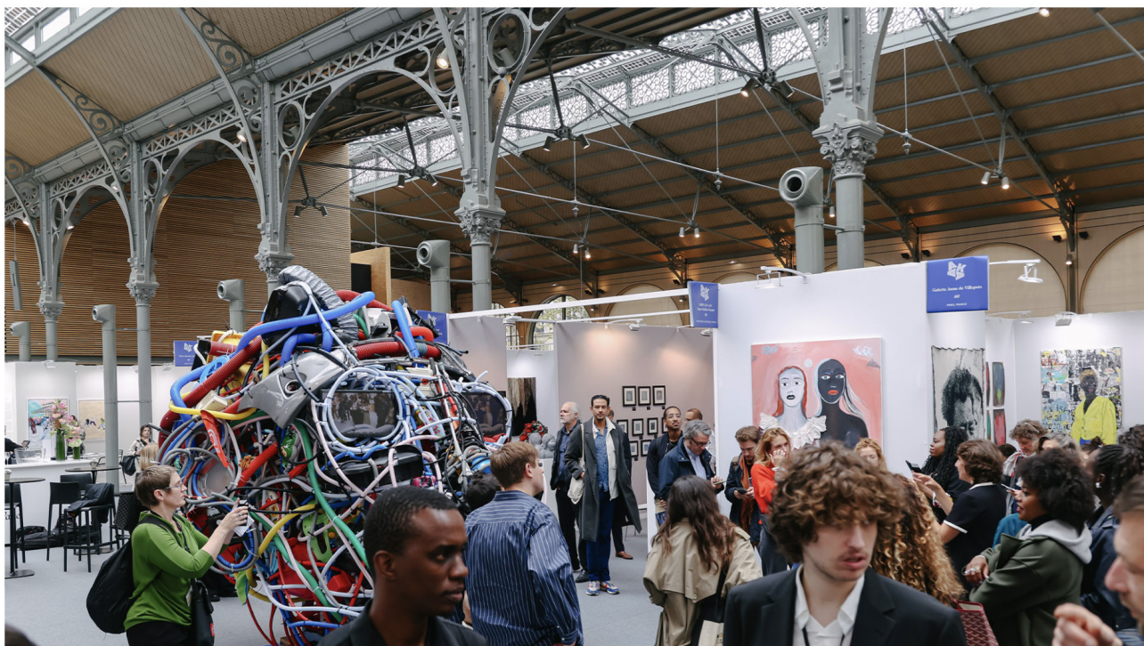
Vue de la foire AKAA en 2024 au Carreau du Temple

La Semaine de l'art bat son plein à Paris, et au-delà des murs du Grand Palais où vrombit Art Basel, une myriade de foires offre un panorama éclectique de l'art contemporain. On vous raconte notre marathon des foires en 9 étapes.