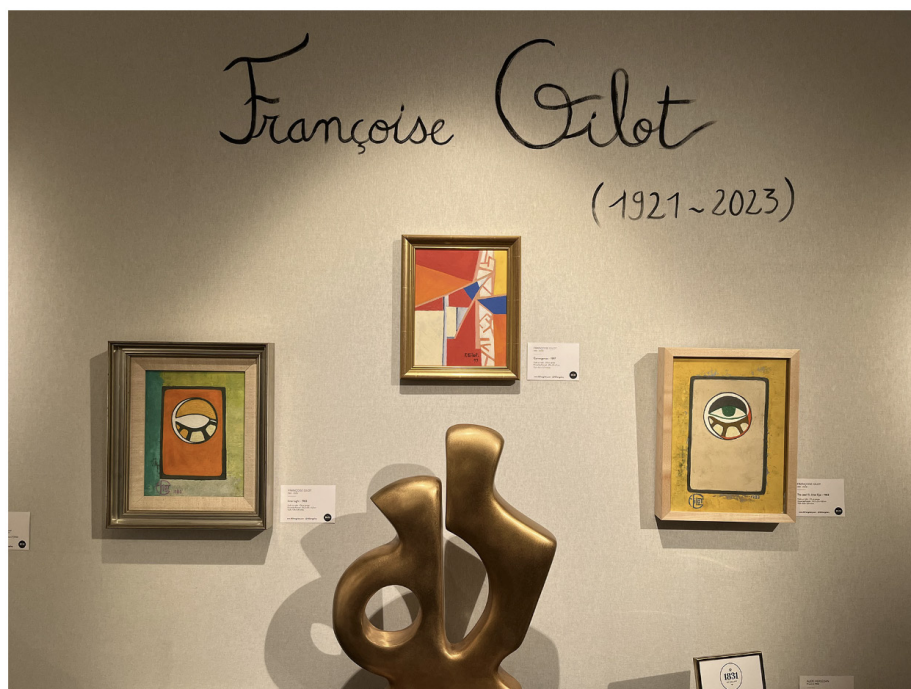
Trois des cinq œuvres de Françoise Gilot présentées par 1831 Art Gallery et Rosenberg & Co. à Moderne Art Fair en 2024

Moderne Art Fair, avenue des Champs-Élysées, 75008 Paris, du 17 au 20 octobre