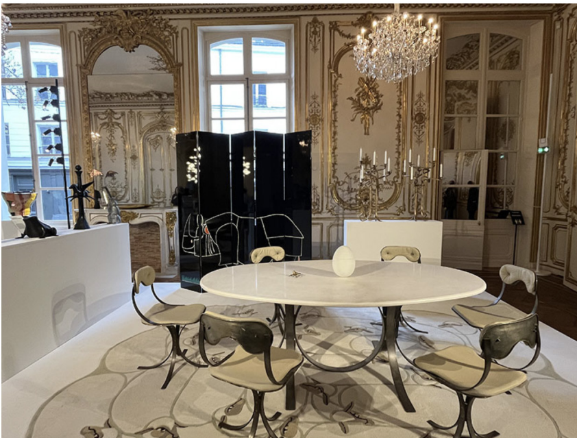
Un ensemble unique de mobilier de salle à manger par Claude and François-Xavier Lalanne sur le stand de la galerie Mitterrand à Design Miami 2024

Design Miami Paris, L'hôtel de Maisons, 51, rue de l'Université, 75007 Paris, designmiami.com du 15 au 20 octobre