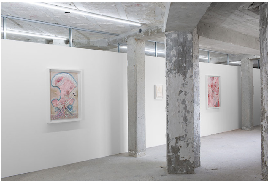
Les oeuvres de Bonnie Lucas présentées par ILY2 (Portland) à la foire Paris Internationale en 2024

Paris Internationale, 17 rue du Faubourg Poissonnière, 75009 Paris, du 15 au 20 octobre