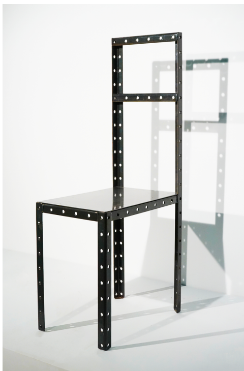
Bob Wilson Chaise Hamletmachine, ca. 1986

Né à Waco, au Texas, Wilson fait partie des artistes de théâtre et des artistes visuels les plus en vue au monde. Ses images sont esthétiquement frappantes et chargées d'émotion, et ses productions ont été acclamées par le public et les critiques du monde entier. Wilson a laissé son empreinte sur le monde de la scène grâce à ses productions innovantes et visuellement saisissantes.