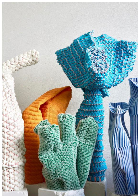
© Knitted Light par Sangmin Oh

COLLECTIBLE, la foire internationale consacrée au design contemporain de collection, est ravie d'annoncer son retour à l'Espace Vanderborght à Bruxelles pour sa 7e édition du 7 au 10 mars 2023. Depuis sa création en 2017, COLLECTIBLE s'attache à ne présenter que des œuvres de haute facture, reflets des derniers courants et innovations en matière de design, en favorisant les pièces uniques et éditions limitées, souvent présentées en première mondiale.