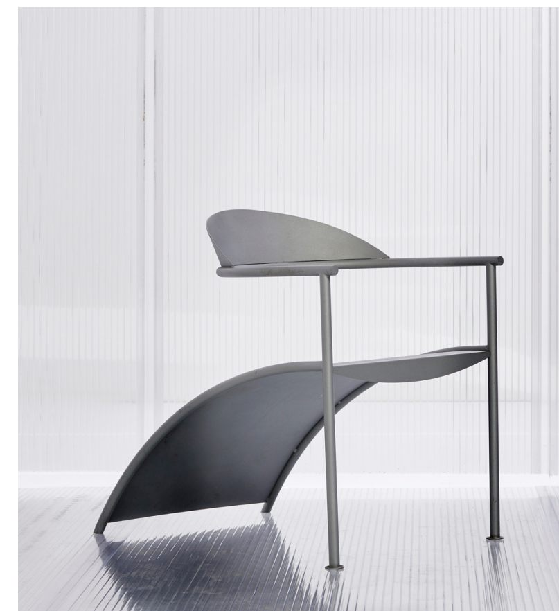
Phillipe Starck Chaise 'Pat Conley II' downtown+ metalloids