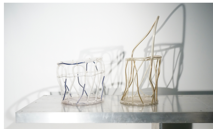
Andrea Branzi Vases en plexiglass, ca. 2000

Andréa Branzi est un architecte et designer italien né le 30 novembre 1938 à Florence. Il est un membre clé du mouvement Radical Design des années 1960 et 1970, ayant cofondé le groupe Archizoom Associati. Après Archizoom, Branzi a continué à influencer le design et l'architecture à travers ses projets, ses écrits et son enseignement, notamment en tant que professeur à la Domus Academy. Reconnu pour son approche novatrice, il a reçu de nombreuses distinctions et ses œuvres figurent dans les collections de musées prestigieux à travers le monde.