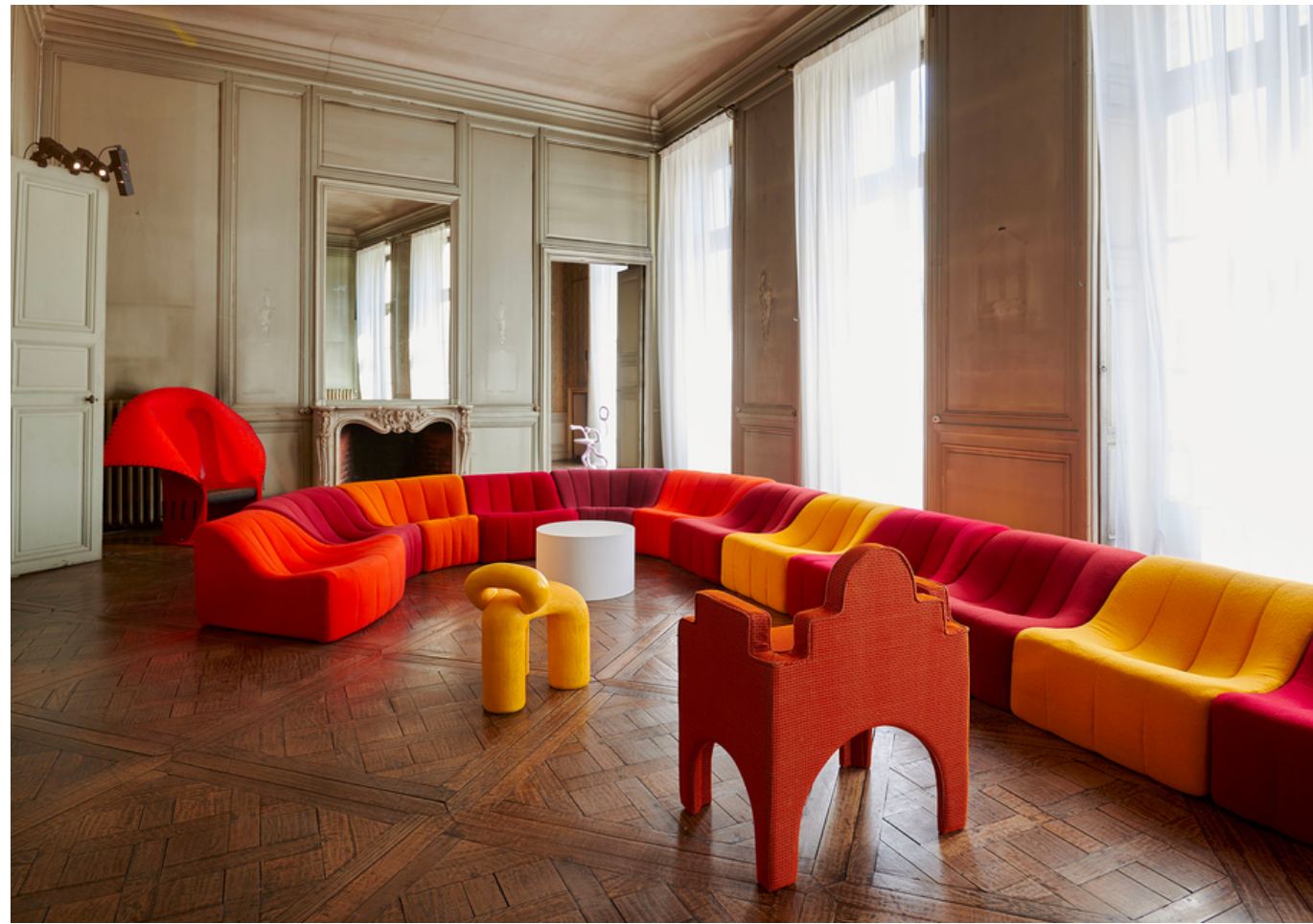
downtown+ trônes exposition – 2023