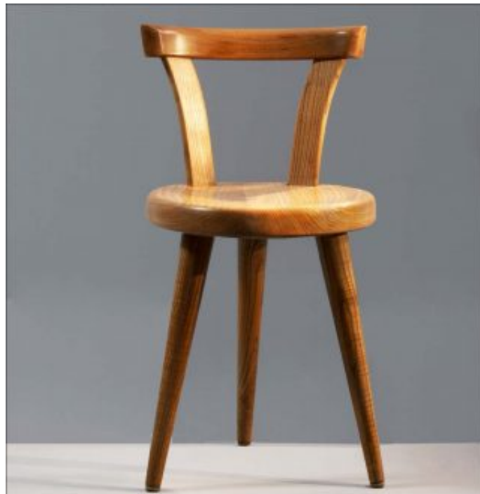
Charlotte Perriand, Chaise BCB, circa 1947. Frêne teinté en jaune. H. 35 x L. 36 x P.67 cm.