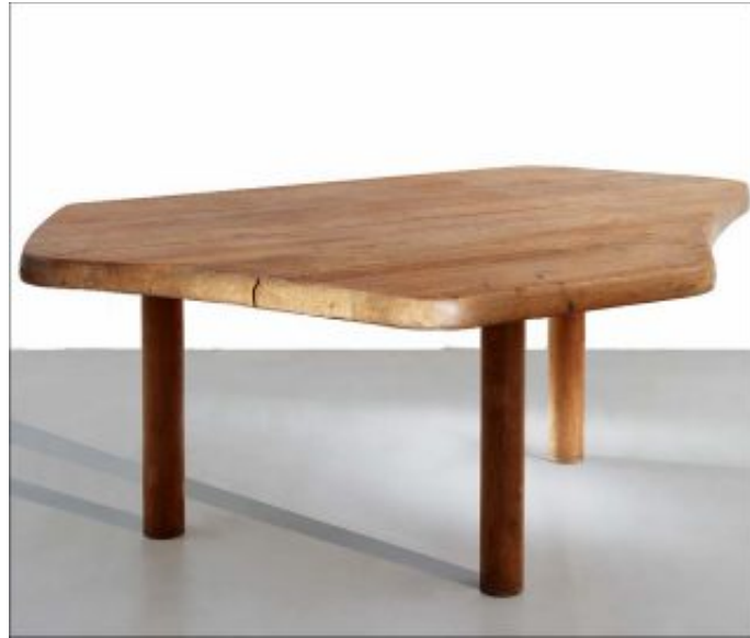
Charlotte Perriand, Table à six pans, 1949. Pin. 71, 5 x 184,5 x 129 cm.