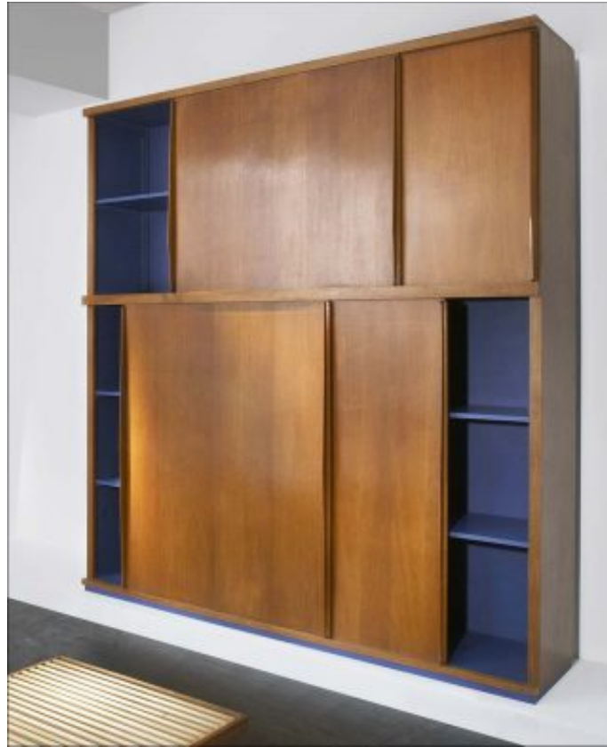
Charlotte Perriand, Meuble de rangement à portes coulissantes, 1959. Chêne. H. 244 x L. 243 x P. 53 cm.