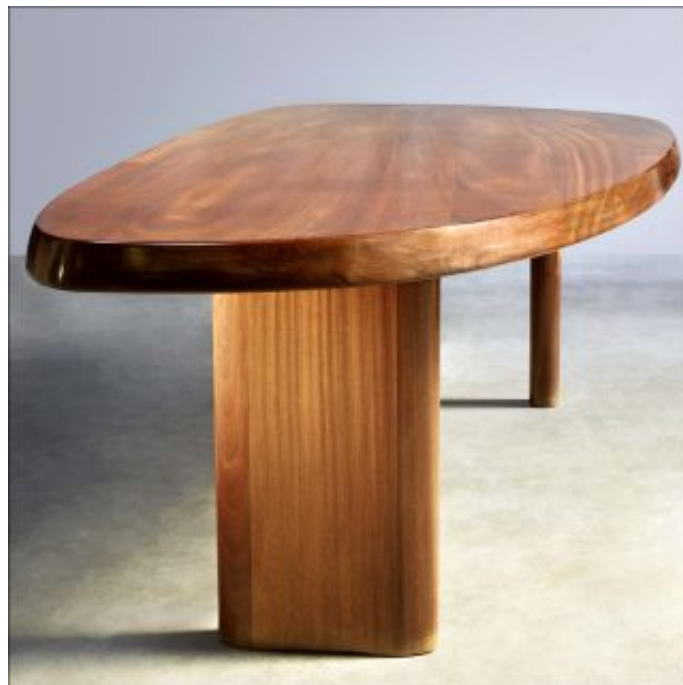
Charlotte Perriand, Forme libre, 1960. Frêne. H. 71 x L. 243 x l. 108.5 x Ep. 6 cm.