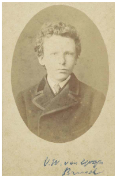
Le portrait de Theo van Gogh, considéré auparavant comme celui de Vincent.