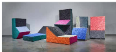
Sang Hoon Kim, Foam Series , 2018. Galerie Cristina Grajales, New York.