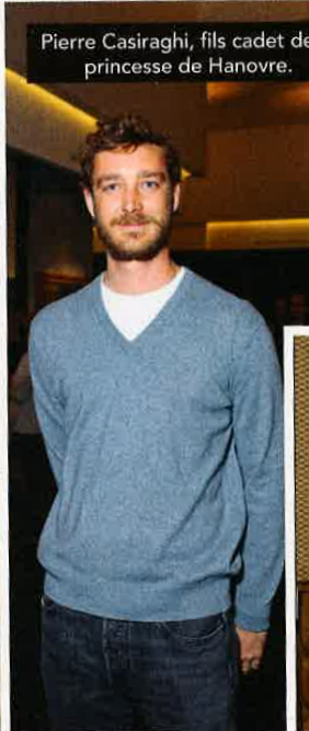
Pierre Casiraghi, fils cadet de la princesse de Hanovre.