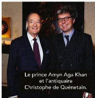
Le prince Aynn Aga Khan et l'antiquaire Christophe de Quénétaïn.