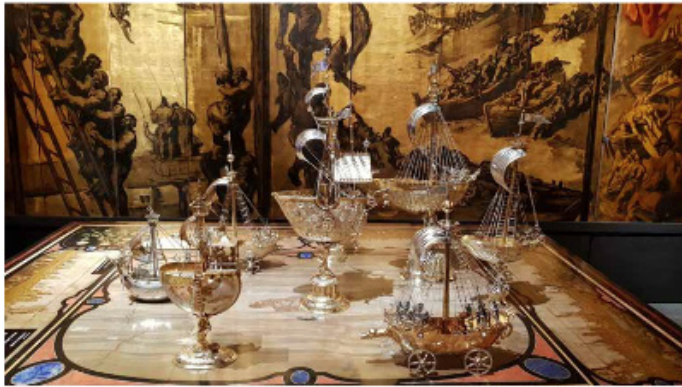
José María Sert, The Fishermen (au mur), et ensemble de nefes d'Augsburg, Nuremberg et Ulm, fin XVI e siècle-début XVII e siècles. Stand de la galerie Kugel (Paris) à la Tefaf Maastricht 2019.