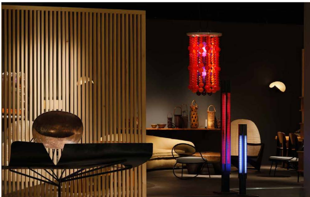
Verner Panton, lustre, années 1970. Galerie Downtown, Paris.