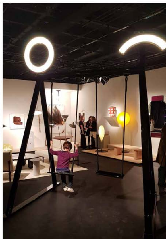
Jean-Baptiste Fastrez, balançoire, 2019. Galerie kreo, Paris.

Design Miami/ Basel, jusqu'au 16 juin, Hall 1 Sud, Messe Basel, Bâle, Suisse, www.designmiami.com