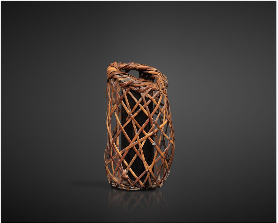
Iizuka Shokansai (1919-2004) Hanakago "Ta-Uta", Ca. 1960-70