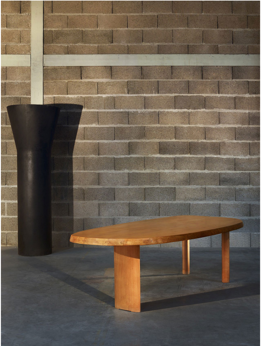
Charlotte Perriand (1903-1999) Table de « Forme Libre », Ca. 1960