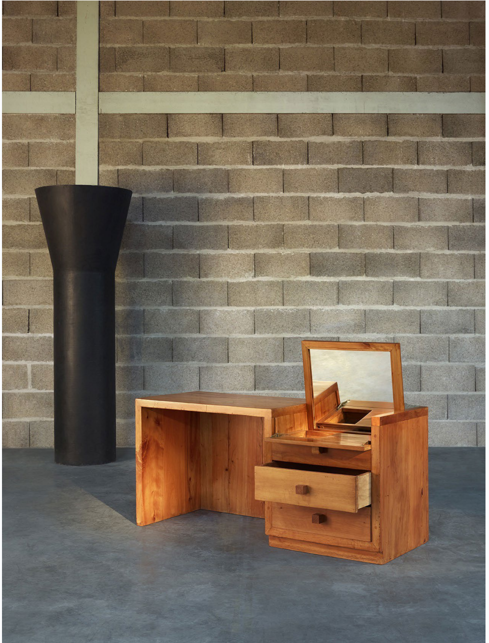
Luis Barragan (1902-1988) Coiffeuse, Ca. 1951