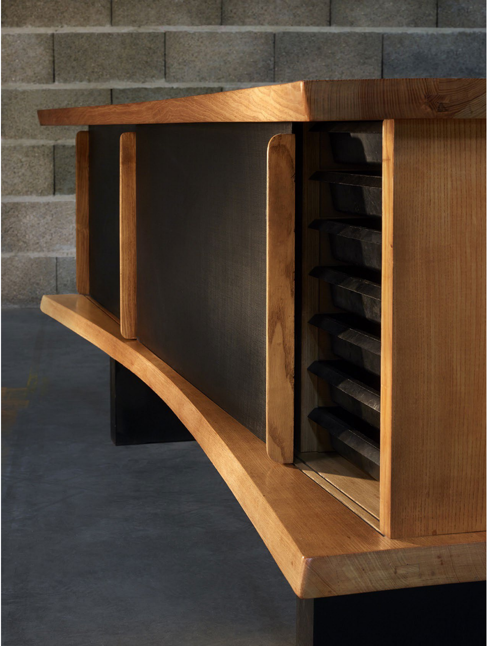
Charlotte Perriand (1903-1999) Bahut « En Forme », Ca. 1959