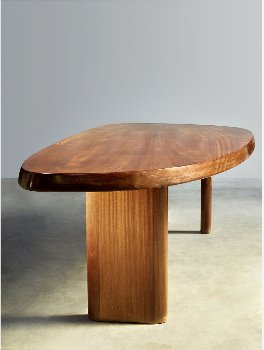
Charlotte Perriand (1904-1999) Free Form Table Ca. 1957