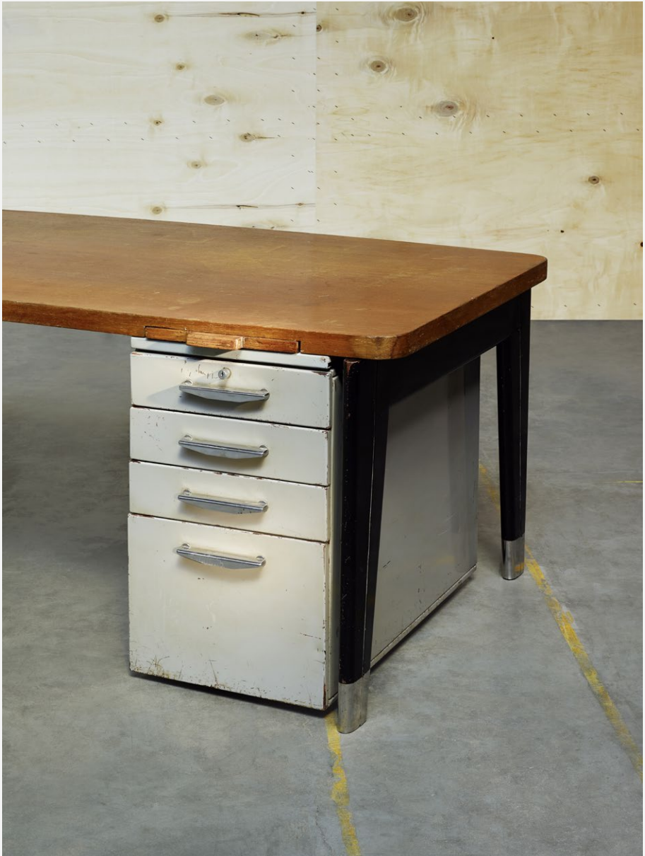
Jean Prouvé (1901-1984) «Présidence Desk» Ca. 1950