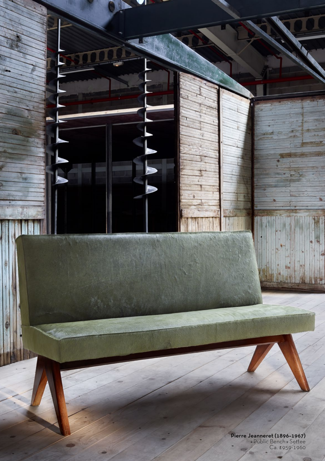
Pierre Jeanneret (1896-1967) « Public Bench » Settee Ca. 1959-1960