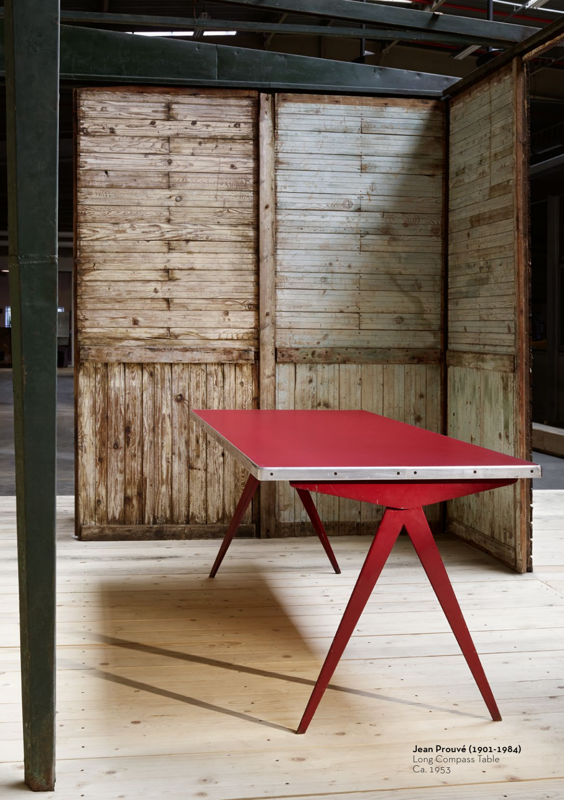
Jean Prouvé (1901-1984) Long Compass Table Ca. 1953