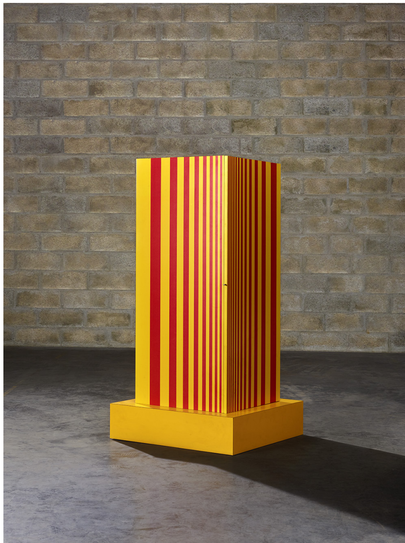
Ettore Sottsass, Superbox , 1968 H. 169 x l. 80 x P. 80 cm Bois mélaminé