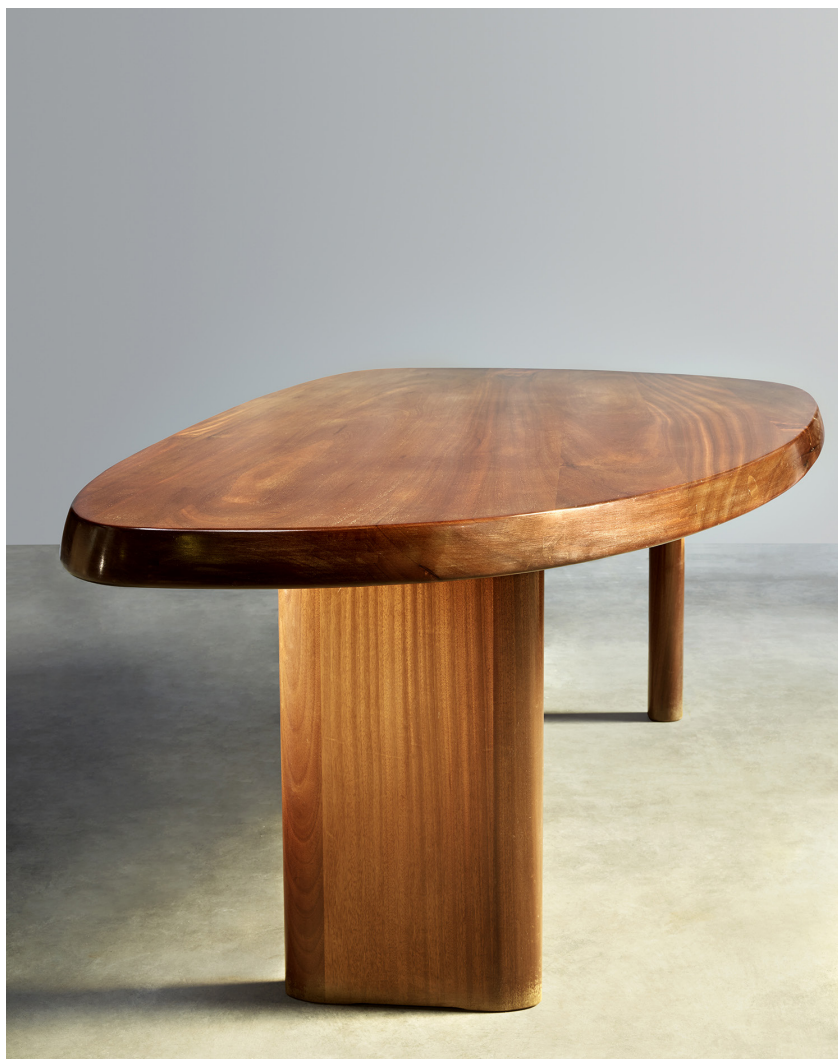
© Marie Clérin / Laffanour Galerie Downtown, Paris Charlotte Perriand, Table de Forme-Libre , 1957 H. 71 x L. 236 x l. 107,5 x Ep. 6 cm Acajou