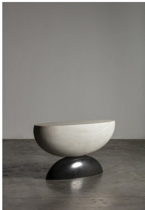
Choi Byung Hoon (B. 1952) Afterimage O9-327, 2009 Console en granit noir et marbre blanc

La Galerie Downtown a toujours été une ambassade pour ces designers ou architectes et plus naturellement pour cet esprit asiatique ou extrême oriental – zen – qui nourrit les arts décoratifs depuis la Route de la Soie. La plateforme créée par Asia Now est une opportunité pour la galerie de se placer d'un point de vue « asiatique » sur son travail depuis près de 40 ans.