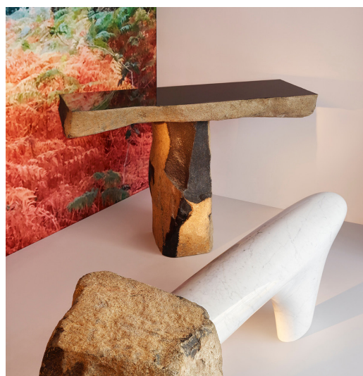
Choi Byung Hoon (1952 - )