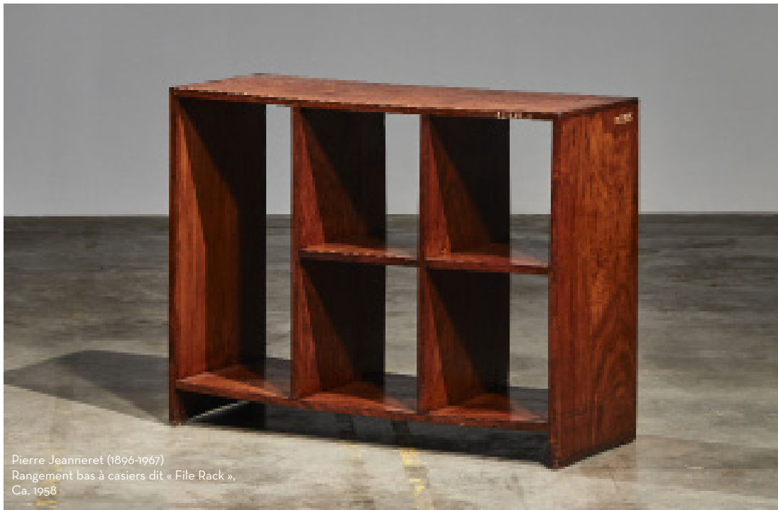
Pierre Jeanneret (1896-1967) Rangement bas à casiers dit « File Rack », Ca. 1958