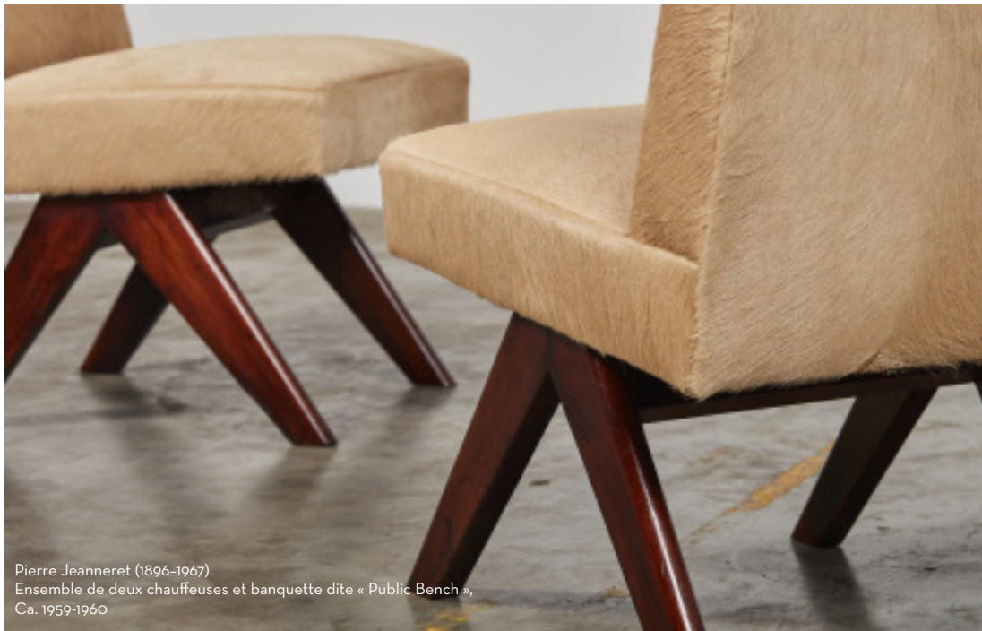
Pierre Jeanneret (1896-1967) Ensemble de deux chauffeuses et banquette dite « Public Bench », Ca. 1959-1960