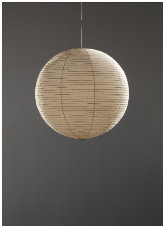
Isamu Noguchi (1904 - 1988) Ensemble de rares suspensions boule « Akari », Ca. 1960