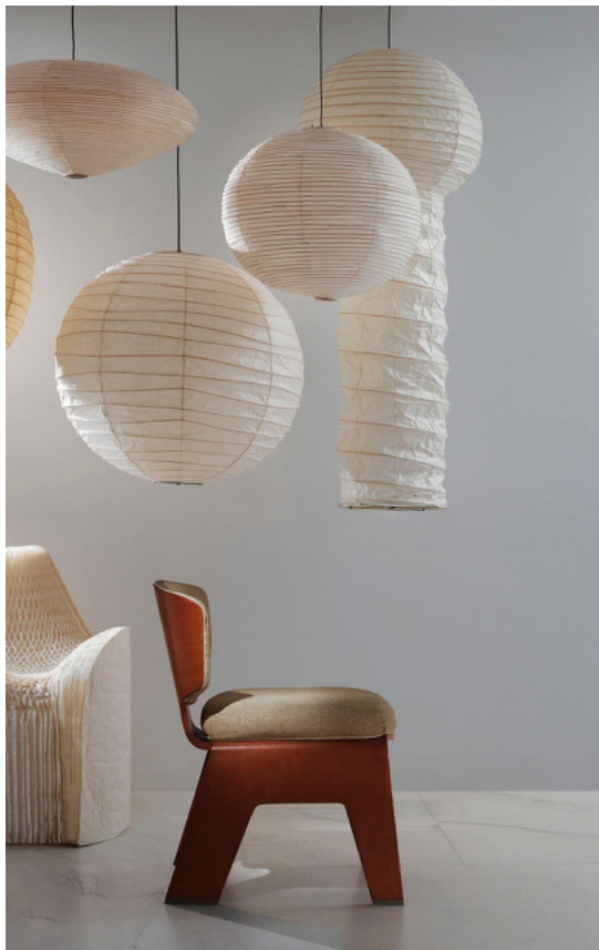
Isamu Noguchi (1904 - 1988) Ensemble de rares suspensions boule « Akari ». Ca 1960