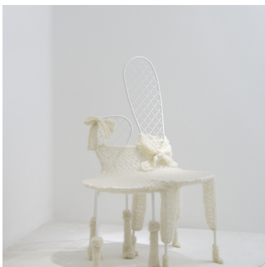
Jun'ya Ishigami (1974 - ) Fauteuils

Sur son stand, la Galerie Downtown proposera à la fois des pièces phares et des modèles plus rares comme des chaises de Kenzo Tange réalisées au début des années 50 ou encore des chaises contemporaines d'Ishigami avec un tissu singulier exposées à la galerie par François Laffanour depuis 2008.