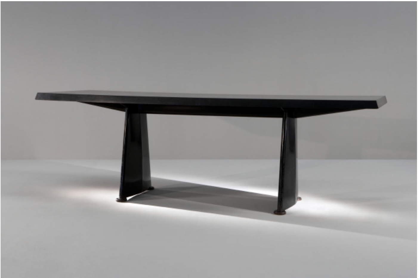
Jean Prouvé (1901-1984), Table « Trapèze », Ca. 1954

CHARLOTTE PERRIAND, JEAN ROYÈRE, JEAN PROUVÉ, PIERRE JEANNERET, SERGE MOUILLE